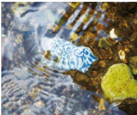
表紙写真：川底に沈む蜻唐草文様のベンジャラ。