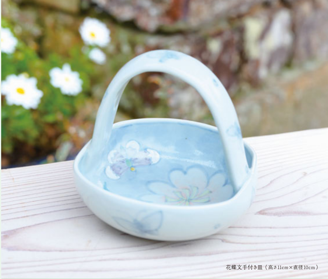
花蝶文手付き皿（高さ11cm×直径10cm）