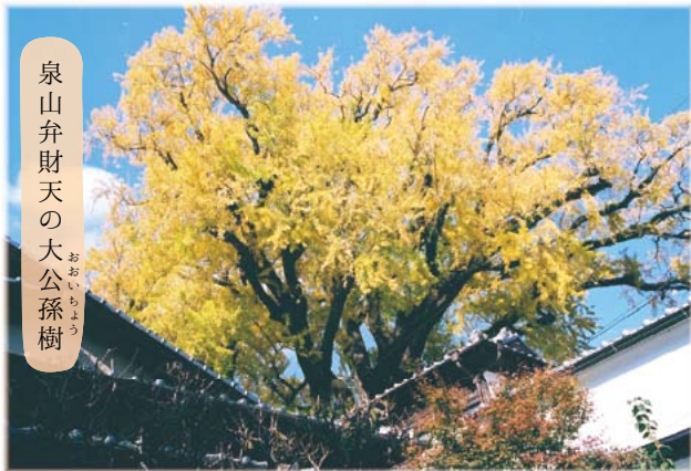
泉山弁財天の大公孫樹 おおいちよう