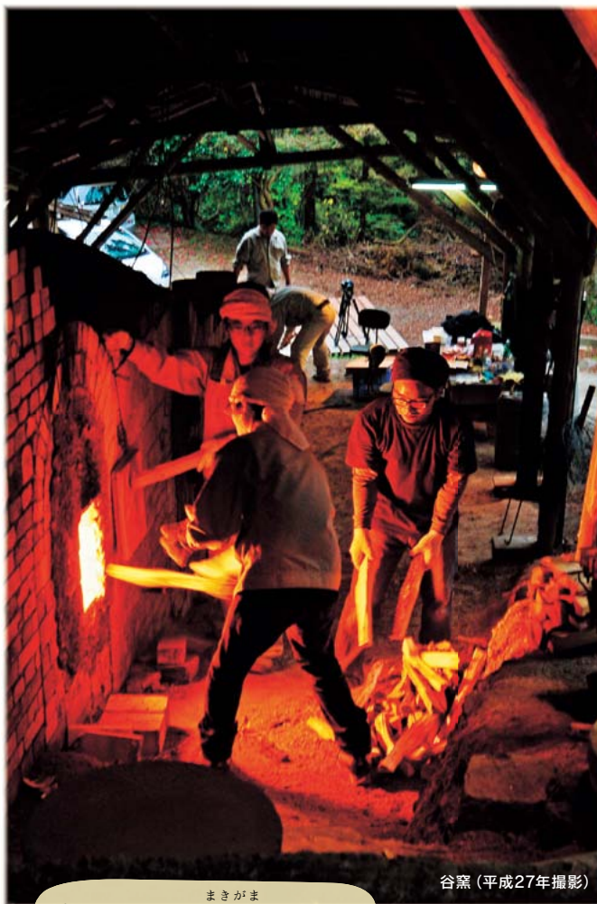
まきがま 焱の響演 ～薪窯めぐり～

やきもの、郷土料理、紅葉、町の人のおもてなし。 「秋の有田」をどうぞお楽しみ下さい。