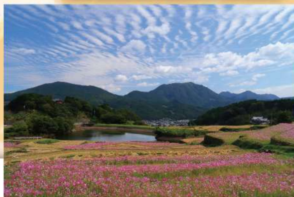
第12回 優秀賞作品 「旅秋くりよしゅう」木寺重男