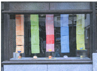
← ゲンポーの作品 タイトル「Colors」