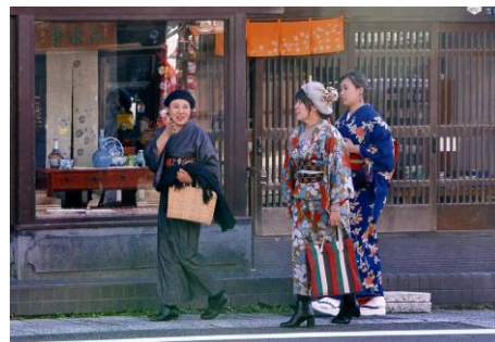
優秀賞「心はずむ有田散歩」

有田の歴史的な町並みが、良く表れている。 散策やお買物を楽しんでいる会話が 聞こえてきそうな作品。