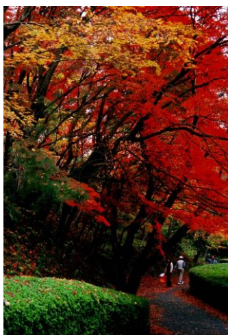
有田観光協会賞「晩秋の有田」

有田にもこんなに綺麗な紅葉の名所があるのだと、 再発見させてくれる。 紅葉の色が大変鮮やかで印象的な作品。