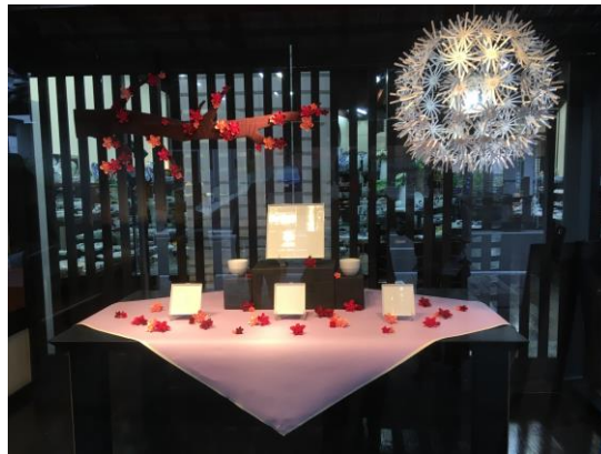
最優秀賞 受賞作品 《梅花の歌》