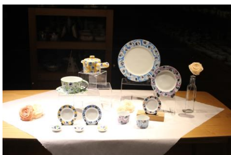
～どすこい拳<パンチ>～ 《心躍る食卓》