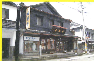
5 有祥堂 [満月のB型メロンパン/有田工高]