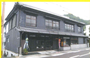
8 鷹巣瑞光堂 [3HI/有田工高]