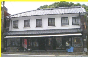
4 大樽陶山堂 [A型ボールペンミサイル/有田工高]