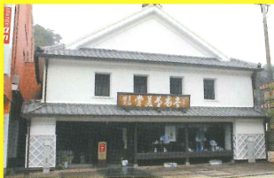
13 賞美堂本店 [らいおんのたまご/有田工高]