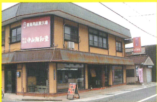
1 中山陶和堂 [みどり/有田工高]