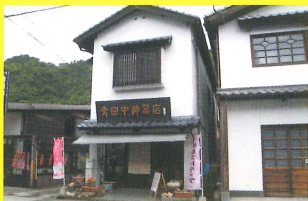
3 田中陶器店 [にゃんちゅう/有田工高]