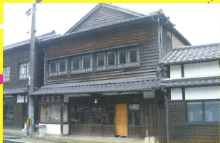
14 陶悦窯 町屋 [activity/有田工高]