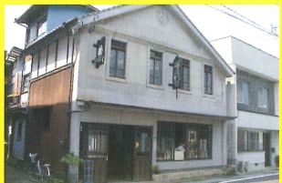
2 バグとユメコのお店 [チョコレートたけのご/有田工高]