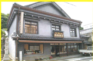
9 三光堂 [hide and seek/伊万里商高]