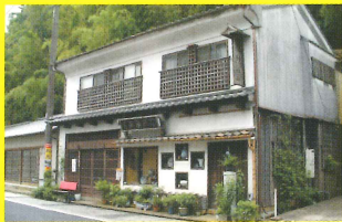
12 豊美堂 [チーム活水/活水高校]

平成25年度九州高文連美術・工芸、書道、写真展(佐賀大会)も開催!! 展示期間/A有田館:7月14日(日)~28日(日) B赤絵町工房:7月22日(月)~28日(日)