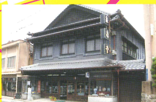
10 泉寿堂[山野池/有田工高]