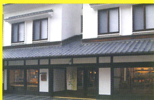
7 藍土[まつもん/有田工高]