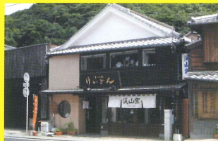
6 うつわ廻けいざん [ちよこれーとキノコ/有田工高]