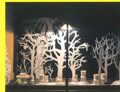
昨年最優秀賞作品(チーム活水/活水高校)