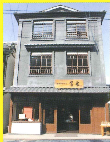
11 肥前赤絵窯元 鷹巣 [佐工/佐世保工高]