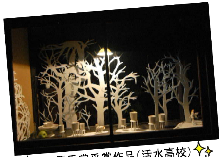
最優秀賞受賞作品(活水高校)